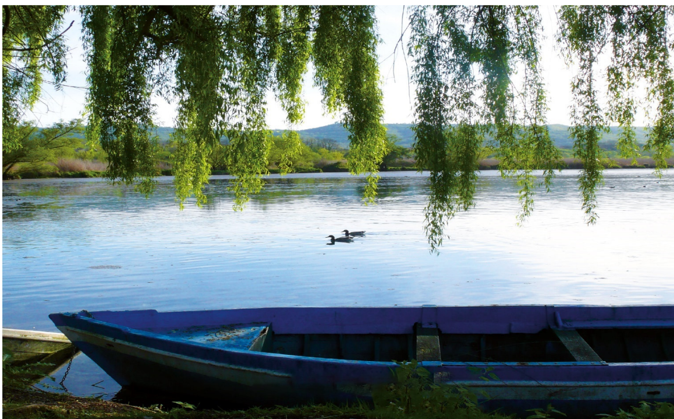
Lago di Posta Fibreno (FR)

La sperimentazione prevede delle analisi periodiche, le quali hanno dato risultati eccellenti nell'ultimo esercizio.