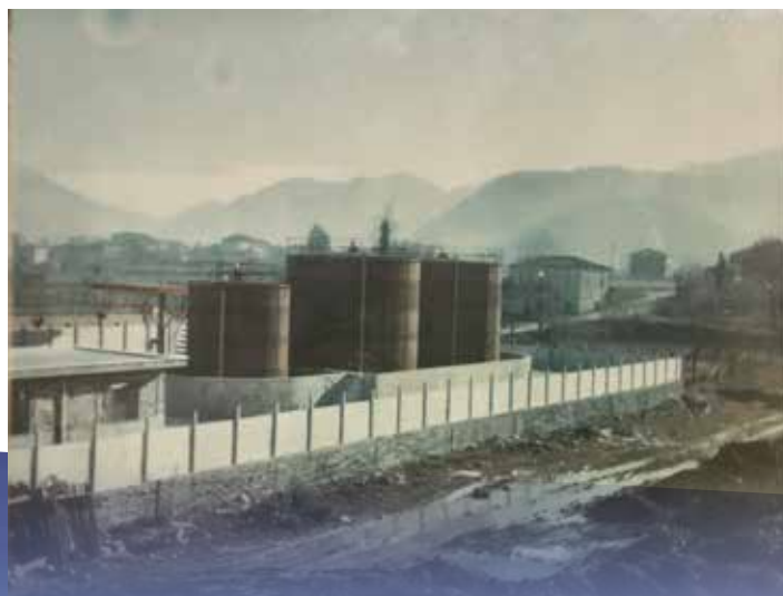
L'impianto La Rocca Petroli in costruzione. Atina, 1975